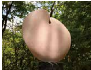
"DISK WIND" ●6 2011. H.92×L.92×S.15cm Rosa Portugallo