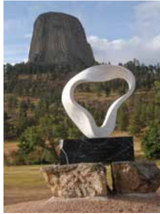
ネイティブアメリカンの聖地 ワイオミング州デビルスタワー 永久設置モニュメント Permanent installation at the Devils Tower (First National Monument), Wyoming, U.S.A.