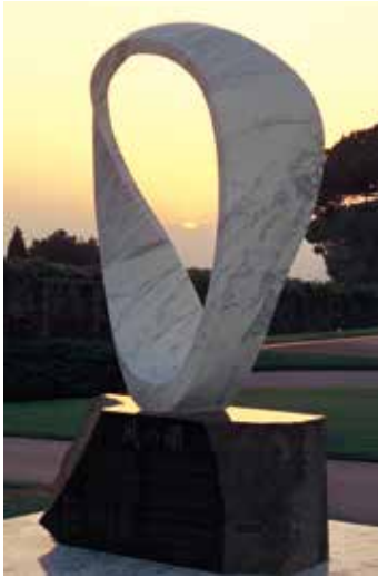
キリスト教の聖地バチカン 永久設置モニュメント ●5 Permanent installation at the Pope's Summer Imperia villa, Castelgandolfo, Vatican

In 2000, the "Circle Wind - PAX 2000" was installed at the Papal Official Residence of the Vatican City. In 2006, the "Circle Wind - PAX2005" was installed in the Mahabodhi Temple (World Heritage site) of Buddha Gaya, India, known as the birthplace of Buddhism, as a monument symbolizing world peace. And also in 2009, the "Circle Wind - PAX2008" was installed at National park of Devils Tower National Monument, Wyoming, USA as a message for future generations. Akishima-Showa no Mori Junkyu Muto Sculpture Museum will display 9 marble sculptural masterpieces including these memorable monument 1/2 models. Please fully enjoy the harmony of nature and art.