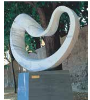
イタリア ピエトラサンタ 永久設置モニュメント ●1 Permanent installation in Pietrasanta, Italy