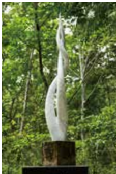
MALE AND FEMALE ●7 "男と女" 2011. H.120×L.22×S.14cm Italian marble