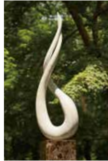
MALE AND FEMALE ●4 "男と女" 2011. H.104×L.32×S.16cm Italian marble