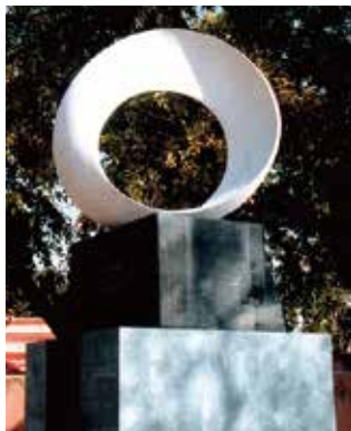
仏教の聖地インド・ブッダガヤ 永久設置モニュメント ●8 Permanent installation at Mahabodhi Temple (The World Heritage), Buddha Gaya, India