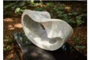
"CIRCLE WIND" ●2 2011. H.52×L.90×S.45cm Italian marble