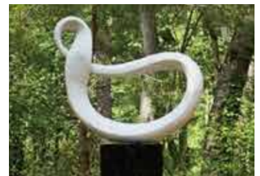
"CIRCLE WIND" —PAX2011— 「N.Y. 9.11 慰霊モニュメント」 -For all victims of 9.11th- 2011. H.72×L.112×S.24cm Italian marble ●9